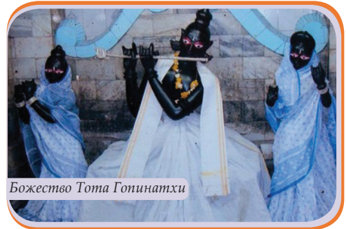
Божество Тота Гопинатхи

Также сильнейшее впечатление на меня произвело Божество Тота Гопинатхи . Большой черный Кришна, который сидит в падмасане. Необычайно сладкое Божество, которое нашел сам Господь Чайтанья, на даршан к которому Он приходил каждый день. Ему поклонялся Гададхара Пандит , который является воплощением Шримати Радхарани. А также считается, что Господь Чайтанья оставил этот мир, войдя в Божество Тота Гопинатхи . Пуджари Тота Гопинатхи и сейчас показывают золотую трещину в колене Божества, в которую вошел Гауранга.