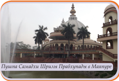
Пушпа Самадхи Шрилы Прабхунады в Маянуре

В Маупре нас, конечно же, поразили размах местного комплекса ИСККОН и строящегося ведического планетария , а также экстаз Kirtan-Mela и количество преданных, которые на него приехали (в основном индусов). Кульминацией нашего пребывания в этой Дхамме была маха-абхихшека , которая проходила 4-го марта. И хотя попасть на нее было практически невозможно, и только редким счастливицам удалось, несмотря на все неудобства, увидеть все зрелище от начала до конца, все же сам дух праздника, чего-то Божественного и великого никого не оставил равнодушным.