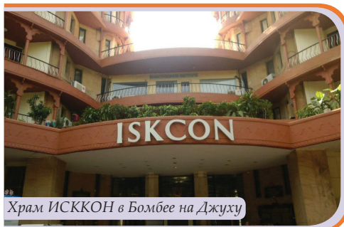
Храм ИСККОН в Бомбее на Джуху