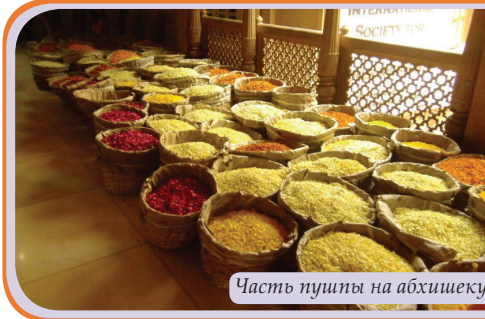
Часть пушпы на абхишеку