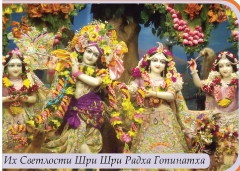
Их Светлости Шри Шри Радха Гопинатха