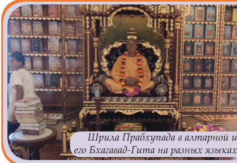
Шрила Прабхупада в алтарной и его Бхагавад-Гита на разных языках

вот, приехали уже. И из Майяпура точно можно никуда дальше не ехать. Вокруг только преданные, Сам Господь Чайтанья - Он есть Кришна, и другие возвышенные Его спутники и наши учителя из парампары, которые пребывали здесь и совершали свои бхаджаны. Строящийся храм Ведического планетария поражает своим размахом.